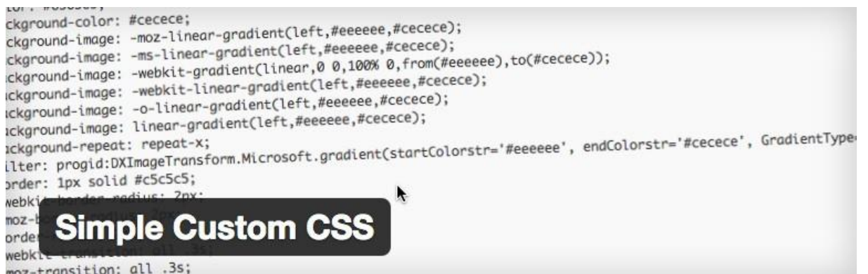
WordPress plugin Simple Custom CSS

Er zijn tegenwoordig dus heel veel wijzigingen mogelijk via de opties van het thema. Alleen zijn er ook nog steeds veel zaken die je alleen maar kunt wijzigen als je diepgaande kennis van de systemen hebt. De keuze is dus: standaard laten zonder ingewikkelde wijzigingen of iemand inhuren voor het maken van deze wijzigingen.